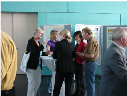
Erfahrungsaustausch in den Pausen

Mit einem Becher Eis für jede Teilnehmerin und jeden Teilnehmer der KOSIS-Gemeinschaftstagung feierte die KOSIS-Gemeinschaft DUVA ihr 20-jähriges Jubiläum. Das verbesserte die Stimmung zusätzlich bei der diesjährigen Gemeinschaftstagung, die in den ausgezeichnet geeigneten Räumen der Region Hannover stattfinden konnte (vielen Dank für die Unterstützung!). Beteiligt waren mit SIKURS, HHSTAT, AGK, DUVA, KOWAHL, Urban Audit und KORIS so viele KOSIS-Gemeinschaften wie noch nie.