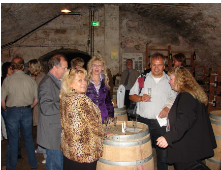
In den Gewölben der Sektkellerei Duprès-Kollmeyer.

Neben den Mitgliederversammlungen der Gemeinschaften enthielt das Programm weit über 20 weitere Veranstaltungen, darunter auch wieder kollektive Workshops unterschiedlicher Gemeinschaften. Beim gemeinsamen Plenum konnten die Teilnehmer/-innen die Neuigkeiten aus den jeweils anderen Gemeinschaften erfahren.