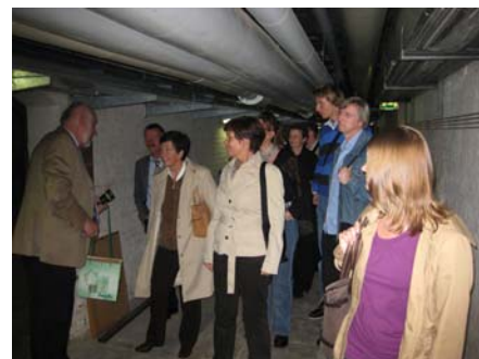
.....sondern auch von den Kellergängen des Rathauses und den dort untergebrachten Einrichtungen.

Um Reisekosten und Arbeitsaufwand gering zu halten sollen künftige Mitgliederversammlungen der KOSIS-Gemeinschaft KOWAHL im Rahmen der KOSIS-Gemeinschaftstagen stattfinden.