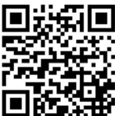
QR-Code zur KOSIS-App

Die App ist über einen Browser vom Smartphone oder am PC über www.staedtestatistik.de/Kosisapp.html aufrufbar und kann für Endgeräte mit dem Android-Betriebssystem im Google-PlayStore heruntergeladen werden.